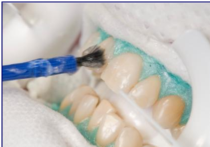
Nachdem das Zahnfleisch mit einem Schutz abgedeckt wurde, kommt das Bleaching-Gel auf die Zähne

Wie beim Home-Bleaching müssen die Zähne zuerst untersucht werden: Wenn sie Löcher, Risse oder undichte Füllungen haben, kann es beim Bleaching Probleme geben. Dann werden die Zähne gründlich gereinigt. Nur so kann das Bleaching-Gel richtig wirken. Bevor das eigentliche Bleaching beginnt, muss das Zahnfleisch mit einem speziellen Schutz abgedeckt werden.