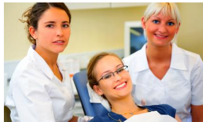
Regelmäßige Professionelle Zahnreinigung in der Praxis hält die Zähne hell und schützt vor Karies, Parodontose und Mundgeruch

Das hält nicht nur die Zähne länger hell. Es schützt sie auch vor Karies und Parodontose und es vermindert möglichen Mundgeruch .