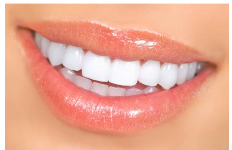
Power-Bleaching: Sichtbar hellere Zähne nach einer Stunde

Was kann man tun, wenn nur ein einzelner Zahn dunkel ist? Auf der nächsten Seite finden Sie Informationen zur Einzelzahn-Aufhellung!